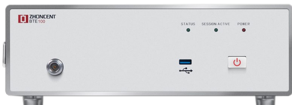
图 4 BTE100 蓝牙综合测试仪

针对蓝牙射频一致性测试,北京度纬科技有限公司销售的 BTE100 蓝牙综合测试仪是完全满足要求的。