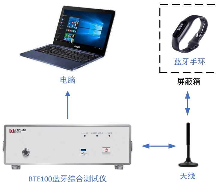
图 1 蓝牙手环射频一致性测试连接图

单终端蓝牙射频一致性测试系统主要包括：BTE100 蓝牙综合测试仪、天线或射频线缆、控制电脑和被测物。